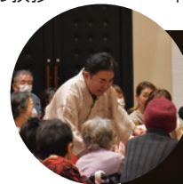
林家三平氏の講演会