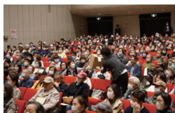
抽選会も大盛況でした