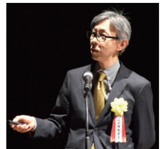
岡村税務署長による講話